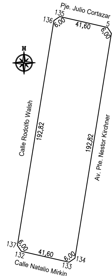
PLANILLA DE COORDENADAS, ANGULOS, LADOS Y SUPERFICIES